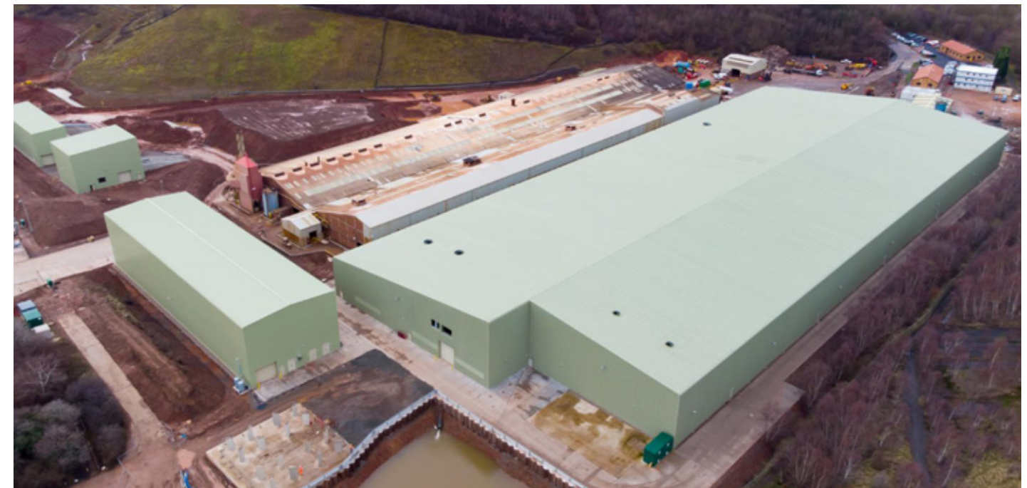
Desford factory under construction ~ Stabilimento di Desford in costruzione

Leicestershire, sarà di fatto il più grande ed efficiente in Europa, un modello di efficienza e sostenibilità con processi automatizzati all'avanguardia che minimizzeranno l'impatto ambientale della linea di produzione. Cuore della linea produttiva i due nuovi forni, concepiti secondo principi sostenibili per ridurre al massimo il consumo energetico e le emissioni di CO2. Al fine di evitare fermi di produzione e garantire il mantenimento dei livelli produttivi, il nuovo sito verrà costruito accanto all'esistente che nel frattempo continuerà a rimanere operativo. L'attuale output di Desford è pari ad 85 milioni di mattoni/anno, ma la nuova linea, una volta a regime, sarà in grado di pro-