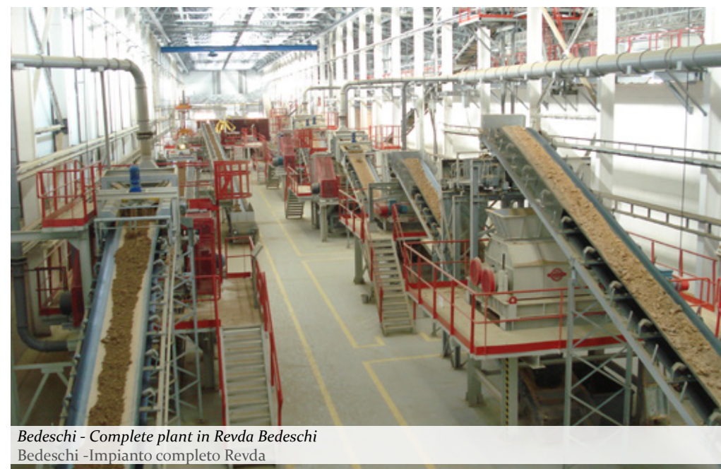
Bedeschi - Complete plant in Revda Bedeschi -Impianto completo Revda