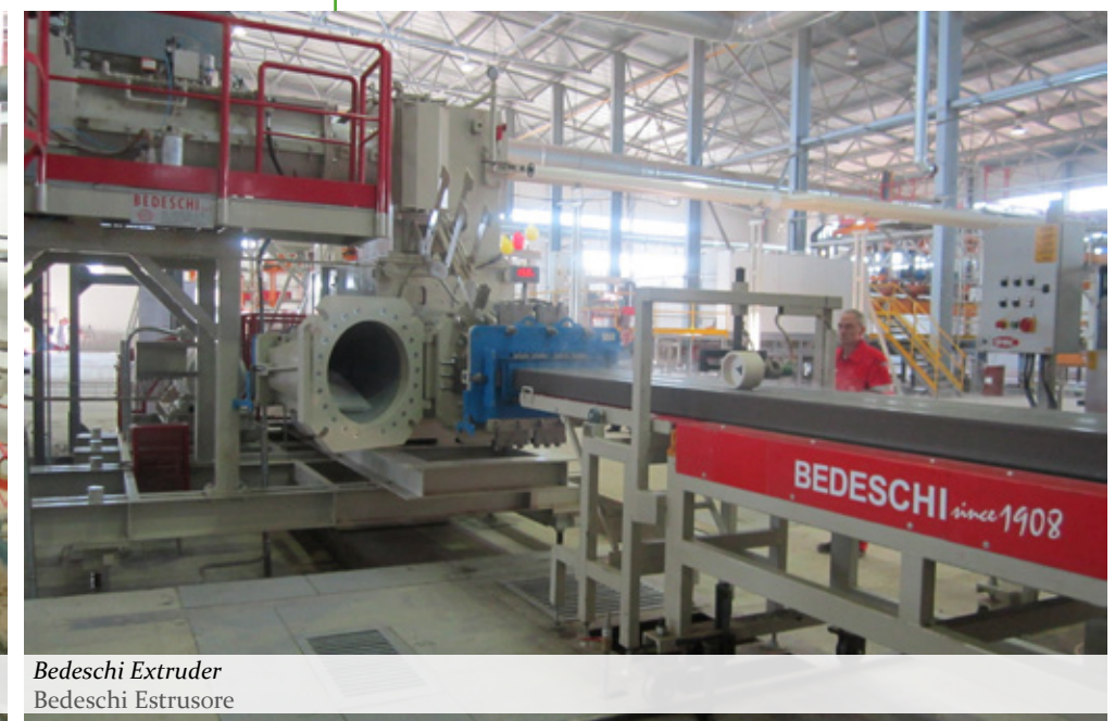
Bedeschi Extruder Bedeschi Estrusore